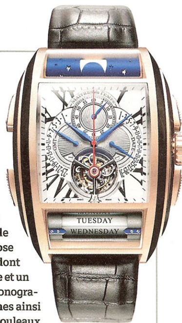
COMPLEXE Signée Christophe Claret, Roger Dubuis et Peter Speake-Marin, la Chapter One coûte 430 400 francs.

promis auront été nécessaires pour aboutir à ce garde-temps au look affirmé, dont les spécialistes chercheront, dans tel ou tel détail, la signature de ses différents créateurs. Avec quelque 662 composants (dont 104 pour le boîtier), ce garde-temps ne propose pas moins de six complications, dont notamment un tourbillon, une date et un second fuseau rétrogrades, un chronographe monopoussoir à roue à colonnes ainsi que deux étonnants et innovants rouleaux, l'un pour les jours de la semaine, l'autre pour les phases de lune. Annoncée pour janvier 2009, la Chapter Two convoquera à nouveau Roger Dubuis et Peter Speake-Marin. Moins exclusive, elle sera produite entre 500 et 1000 exemplaires contre 33 pour ce premier «chapitre». ◦