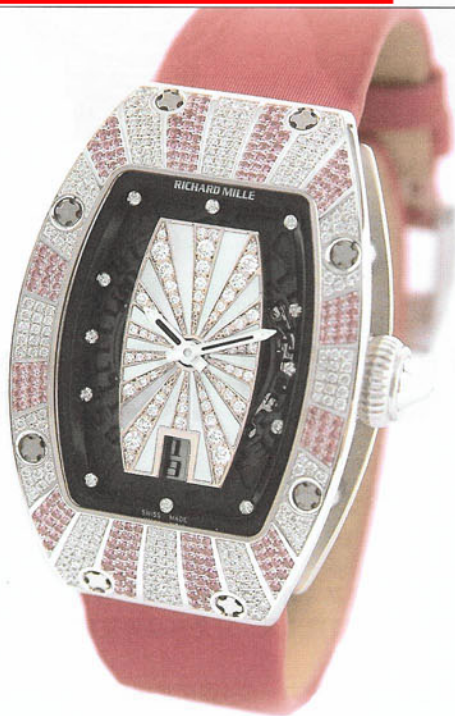
RM007 WG SUN ROSE

007是專門為女士而設，玫瑰金錶殼，上鋪鑲了圓鑽，12小時刻度以幾何線條和鑽石代替。