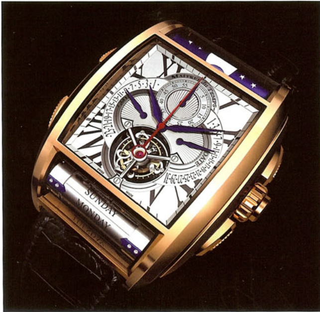
Das aufwendig gemachte Gehäuse beherbergt ein Uhrwerk aus 558 Komponenten