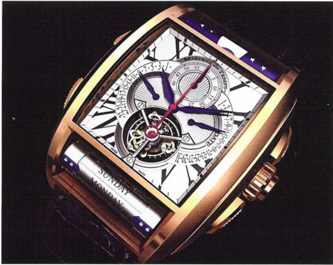
表壳做工精良，机芯由 558 个零件组成。