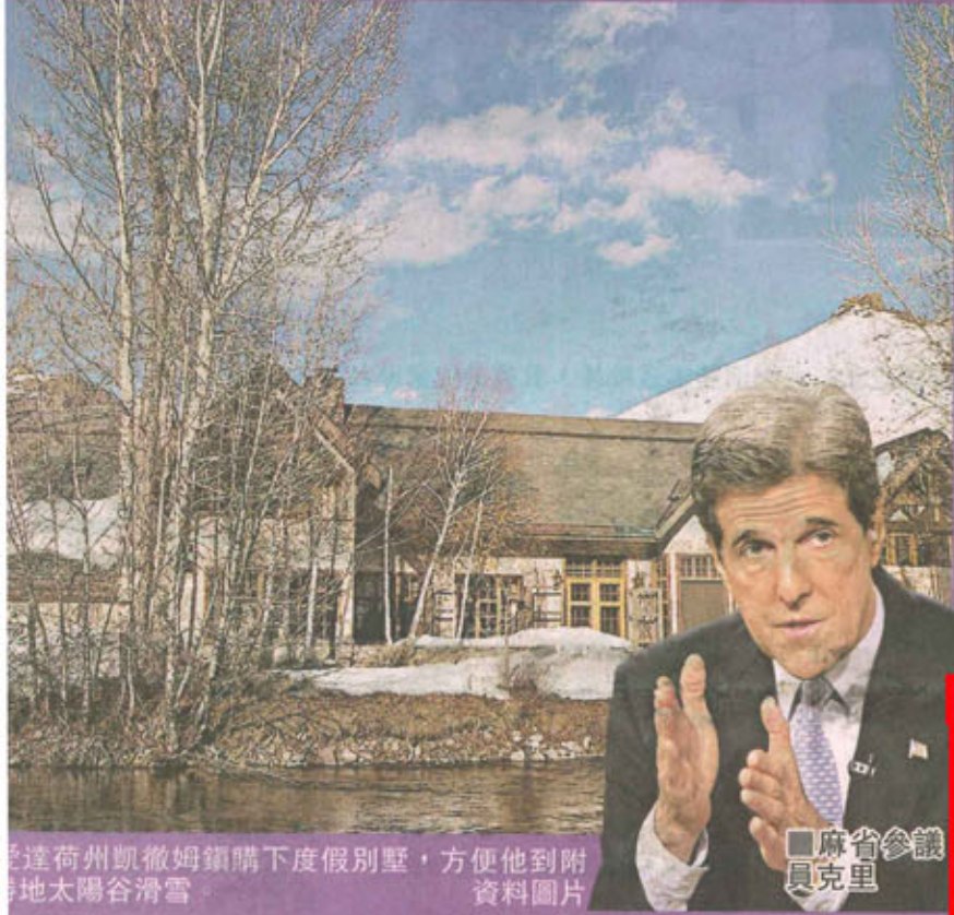
達荷州凱徹姆鎮購下度假別墅，方便他到附地太陽谷滑雪。