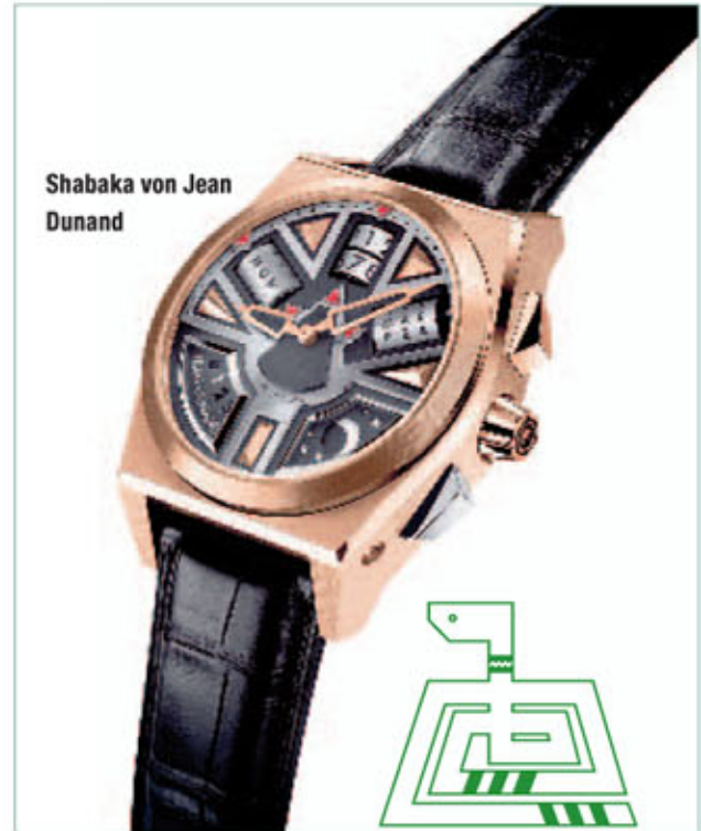
Shabaka von Jean Dunand