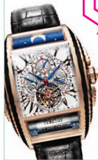
Maitres du Temps