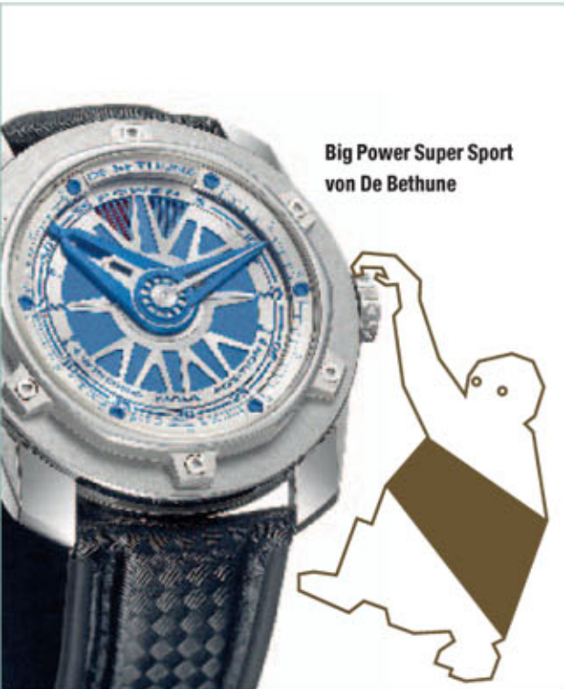
Big Power Super Sport von De Bethune