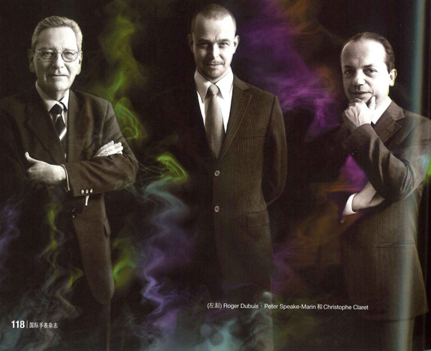
(左起) Roger Dubuis、Peter Speake-Marin 和 Christophe Claret