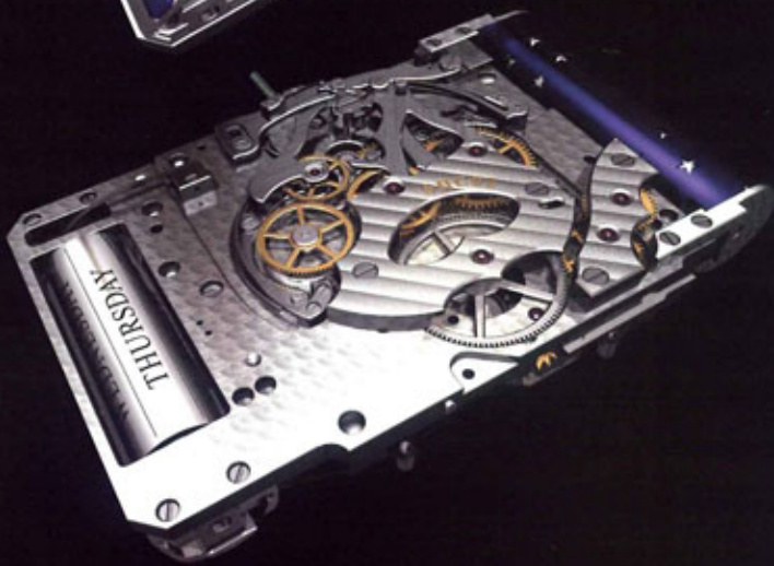
SHC02 机芯包含了 558 个零件，60 小时的动力储存，一分钟一转的陀飞轮机构，21,600 次/小时的震动节拍。